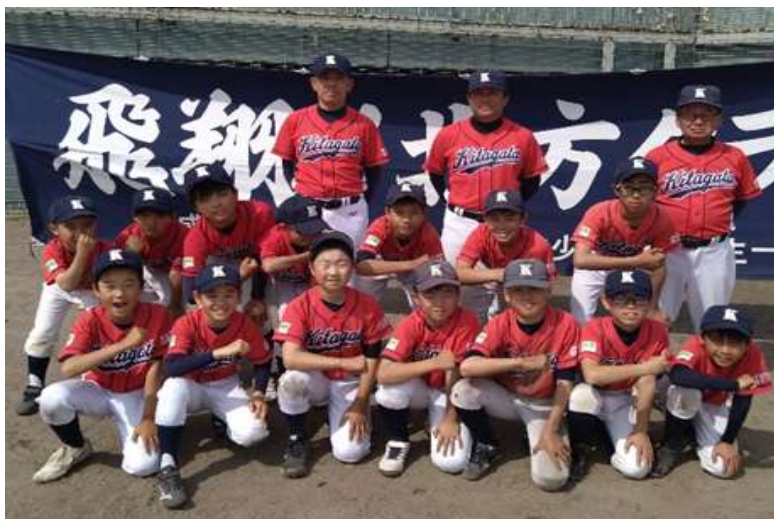
全日本学童 優勝 北方クラブ